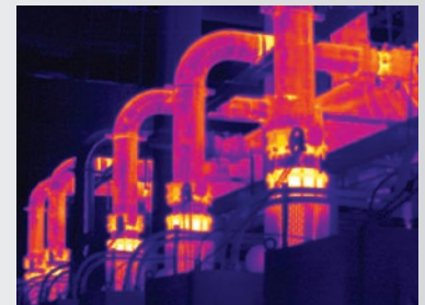
El enfoque MultiSharp™ crea una imagen enfocada para todo el campo de visión