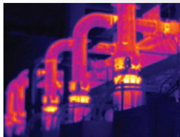
Enfoque manual: enfoca solo la tubería frontal

Todos los objetos 100 % enfocados. Cercanos y lejanos. Enfoque MultiSharp™.